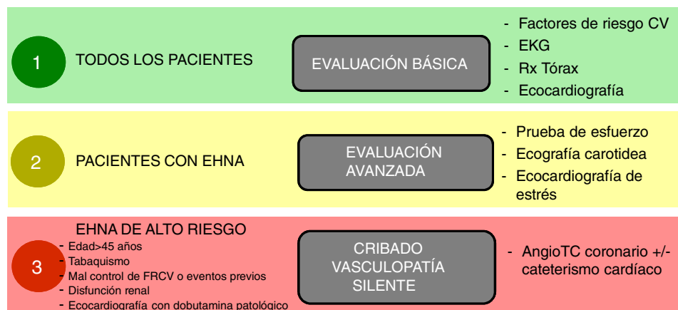
Figura 2 Esquema propuesto de evaluación cardiológica pretrasplante en función del riesgo cardiovascular.

Notas: Los factores de riesgo cardiovascular deben controlarse adecuadamente antes del trasplante.